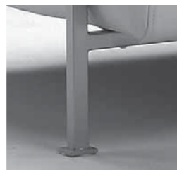
Vakiojalka - kantikas metallijalka - 20x20 mm - maalattuna alumiinin väriin

Standard leg - squared metal leg - 20x20 mm - painted into aluminium color